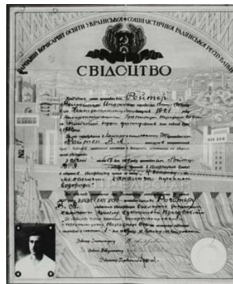
Fig. 1. Certificate of graduation from Dnepropetrovsk institute of peoples' education (on 1st February, 1926) Рис. 1. Свідоцтво про закінчення Дніпропетровського інституту народної освіти (1 лютого 1926 р.)

країні й донині зберігає провідний статус в Україні. Директором ІФХ було призначено його засновника академіка АН УРСР Л. В. Писаржевського [6–8].