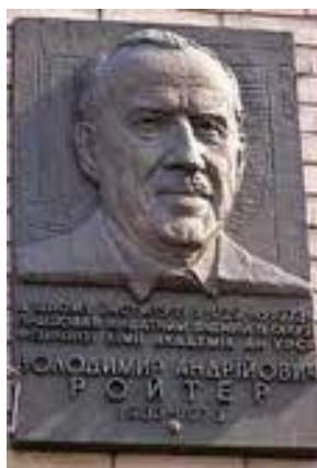
Fig. 4. Memorial plaque of V. A. Royter Рис. 4. Меморіальна дошка В. А. Ройтеру