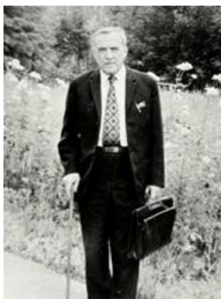
Fig. 3. V. A. Royter (on 26 th July, 1973) Рис. 3. В. А. Ройтер (26 липня 1973 р.)

На фасаді будівлі ІФХ імені Л. В. Писаржевського АН України, де пройшло все трудове життя академіка В. А. Ройтера, для вшанування його пам'яті встановлено меморіальну дошку з барельєфним портретом ученого (скульптор – Ю. Скобликова) (рис. 4).